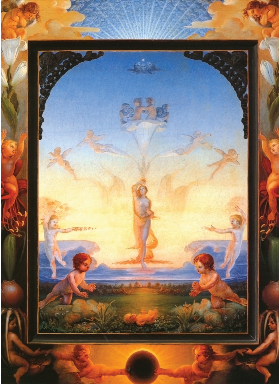
Figur 1. Philipp Otto Runge, Der kleine Morgen (1808), Öl auf Leinwand 109×88,5 cm, Kunsthalle Hamburg (J. Gage, Kulturgeschichte der Farbe. Von der Antike bis zur Gegenwart, Hrsg. v. E.A. Seemann, Berlin 2001, S. 194–195)