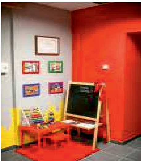
Fot. 4. Kącik zabaw