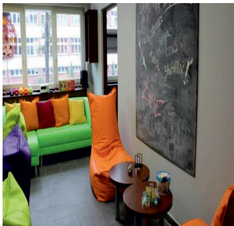
Fot. 3. Miejsce relaksu