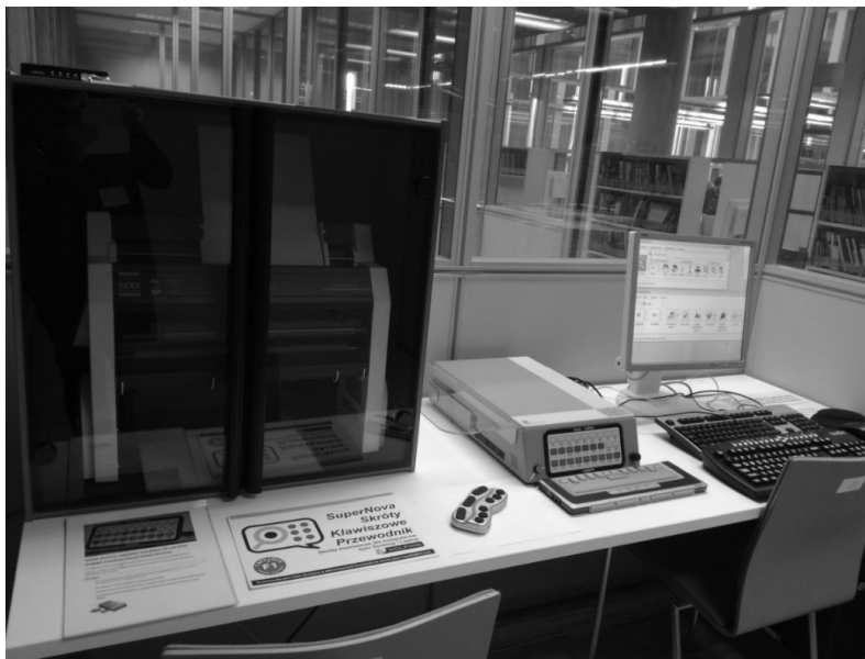
Ilustr. 1. Kabina pracy indywidualnej ze specjalistycznym sprzętem dla osób z dysfunkcją wzroku.

poleceniami głosowymi, drukarka charakteryzuje się tłoczeniem wysokiej jakości brajla oraz możliwością druku grafiki wypukłej.