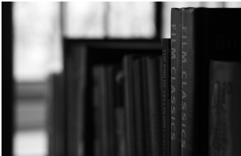
Ilustr. 2. Magazyn Biblioteki Wydziału Radia i Telewizji.