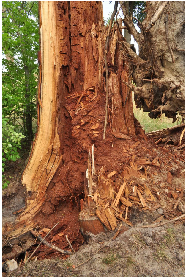
Ryc. 3. Stanowisko odłowu okazu Aphanus rolandri. [Fig. 3. Aphanus rolandri collecting locality].

Budachów [WT07], śródpolna aleja dębowa, 18.07.2015, 1 ex., leg. R. Orzechowski (ryc. 1, 3).