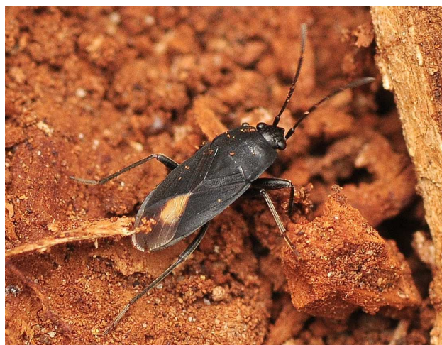
Ryc. 1. Aphanus rolandri. [Fig. 1. Aphanus rolandri].

Osobniki tego gatunku owada znaleźć można przede wszystkim pod korą drzew iglastych i liściastych oraz w ściółce (Péricart 1998, Wachmann i in. 2007). Zarówno larwy, jak imagines A. rolandri są polifagami odżywiającymi się głównie nasionami, ale mogą także żerować na strzępkach grzybni oraz martwych ciałach drobnych bezkręgowców (Péricart 1998, Wachmann i in. 2007). Zimują owady dorosłe, nierzadko w dużych agregacjach pod mchem i korą drzew.