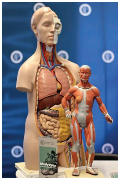
Fot. 4. Model anatomii człowieka, stanowisko Śląskiego Uniwersytetu Medycznego

W czasie Targów na pytania zwiedzających odpowiadali także przedstawiciele Wojewódzkiego Urzędu Pracy w Katowicach oraz Punktu Informacyjnego Funduszy Europejskich w Katowicach. Bardzo istotna była obecność przedstawicieli Projektu Przeciwdziałania Handlowi Ludźmi, dzięki któremu młodzi ludzie mogli dowiedzieć się więcej o tym przerażającym procederze oraz jak się przed nim ustrzec podczas przeglądania ofert pracy wakacyjnej za granicą.