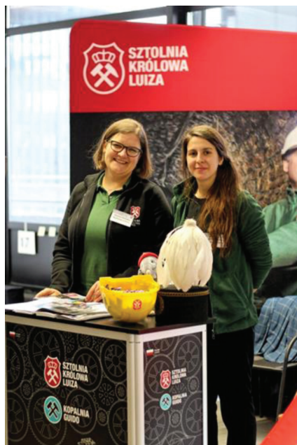
Fot. 5. Przedstawicielki Sztolni Królowa Luiza

W ofercie Targów nie zabrakło również propozycji dla młodszych uczestników – wśród wystawców pojawili się przedstawiciele Śląskiego Ogrodu Zoologicznego, Muzeum Górnictwa Węglowego w Zabrze i Energylandii. Wszystkie te miejsca, kojarzone w pierwszej kolejności z rozrywką, mają w swojej ofercie także elementy edukacyjne, których zakres jest dostosowany do potrzeb zwiedzających.