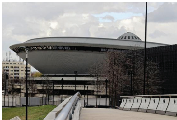
Fot. 1. Hala Widowiskowo-Sportowa Spodek