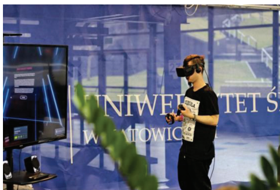
Fot. 2. Stanowisko Uniwersytetu Śląskiego

Drugą imprezą towarzyszącą był XI Salon Funduszy Europejskich (XXI), na którym prezentowano informacje na temat możliwości, jakie daje Unia Europejska; programu Erasmus+; jak odbyć staż lub praktyki w jednej z unijnych instytucji; jak napisać europejskie CV. Dodatkową atrakcją były warsztaty „Bezpieczeństwo w sieci. Jak skutecznie chronić się w Internecie?”.