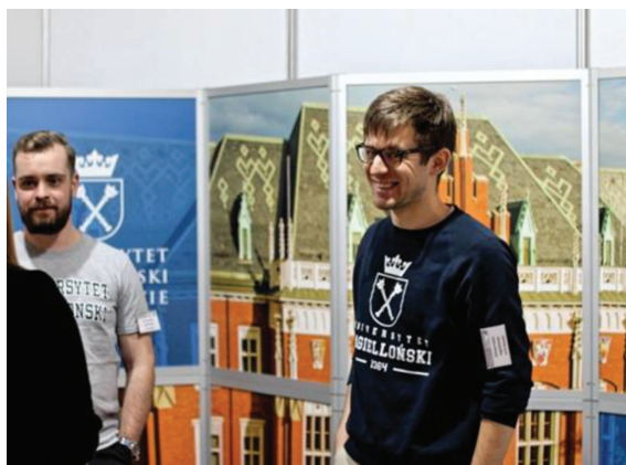
Fot. 3. Stanowisko Uniwersytetu Jagiellońskiego