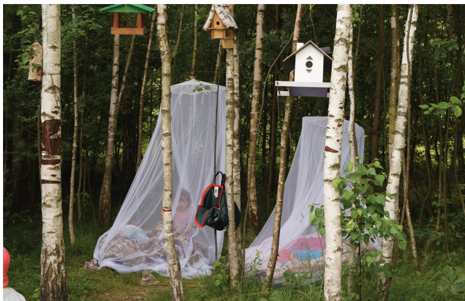
Fot. 1. Odpoczynek poobiedni na łonie natury w leśnym przedszkolu „Puszczyk” w Białymstoku

Bazy leśnych przedszkoli, w postaci namiotu sferycznego, jurty, tipi, barakowozu itp., znajdują się na terenach zielonych takich jak lasy, parki, łąki lub w ich pobliżu. Taka forma schronienia ułatwia kontakt z naturą, chociaż zdarzają się również przedszkola, które korzystają z bardziej klasycznej infrastruktury w postaci murowanego budynku. Cechą charakterystyczną leśnych przedszkoli jest obecny w harmonogramie dnia element wędrówki. Dzieci wraz z opiekunami pakują wózek, w którym znajdują się m.in. apteczka, koce, plandeki chroniące przed ewentualnym deszczem, kilka kompletów ubrań na zmianę itp. Każdy przedszkolak ma również swój plecak, w którym przechowuje m.in. butelkę lub termos z napojem, drugie śniadanie, zimą – zapasowe skarpetki i rękawiczki.