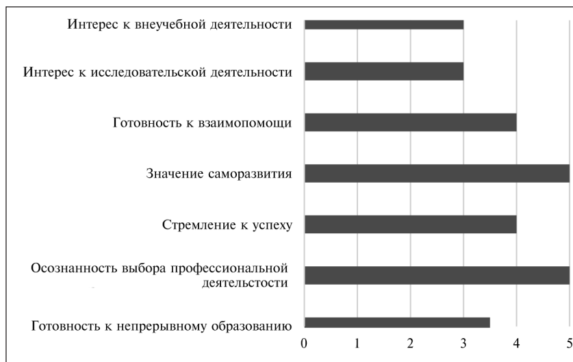
Рис. 1. Мотивационный аспект информационного поведения (медиана основных показателей)

Исследование включало несколько этапов. Во-первых, для студентов была разработана анкета. Анкета включала в себя несколько блоков вопросов, соответствующих структуре информационного поведения, предложенной авторами. В каждом из вопросов респондентам было предложено оценить степень выраженности соответствующего признака или предпочтения по пятибалльной шкале (1 балл – никогда или почти никогда, 2 балла –