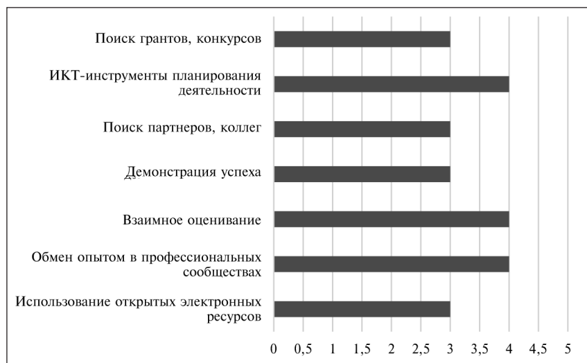
Рис. 3. Стратегии взаимодействий в электронной среде (медиана основных показателей)

Во-вторых, отдельно и более подробно были рассмотрены стратегии взаимодействия в электронной среде (рис. 3). Как уже отмечалось, в обобщенном виде продуктивной стратегией взаимодействия в электронной среде можно назвать сотрудничество. Однако более детально в рамках сотрудничества можно выделить такие важные аспекты деятельности как стремление обмениваться достижениями (в том числе с применением взаимной оценки) и демонстрировать их, обмен опытом в профессионально-ориенти-