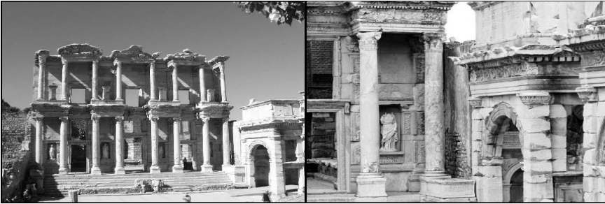
Rysunek 3. Ruiny Biblioteki w Efezie.

Ukończyli ją jednak jego potomkowie około 135 r. n.e., a „Sposób rozplanowania biblioteki różnił się od dotychczas stosowanego – greckiego – z oddzielnymi magazynami na książki. Rzymianie zbudowali jedną salę główną o rozmiarach 10,9 m na 16,7 m, gdzie w niszach przechowywano szafy ze zwojami. Budowano też podwójne mury, które miały chronić zbiory przed wilgocią. W centrum znajdował się prawdopodobnie posąg Ateny, bogini mądrości i nauki” [8]. Do dzisiaj jej ruiny można podziwiać w Efezie (Rysunek 3). Jest to współczesny front biblioteki, zachowany w dobrym stanie [14, s. 179]. Wykopaliska pozwoliły również dokonać rekonstrukcji wnętrza owej biblioteki.