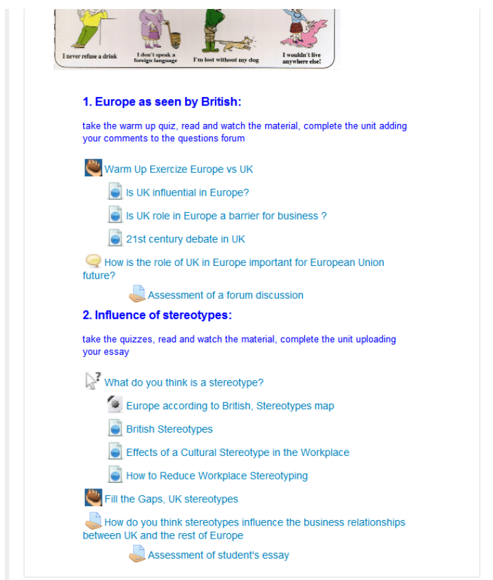
Rysunek 7: Temat „Europe+UK” z kursu „Intercultural Communication” (USWPS, 2014) pokazujący ocenianie poprzez zadania opisowe oraz fora dyskusyjne.

umożliwiającej bardziej precyzyjny pomiar wiedzy ucznia na wejściu i wyjściu. W przypadku testu wstępnego można rozważyć ograniczenie liczby podejść (np. 1) oraz limitu czasu (np. 5 minut) oraz, co ważne, zapewnić ucznia, że wynik tego testu nie będzie miał wpływu na końcową ocenę z kursu. Podobne zasady można ustalić dla testu końcowego, z tą różnicą, że jego rezultaty są zapisywane w dzienniku ocen. O ile ustawienia te są właściwe dla rozróżnienia testów utrwalających, testu wstępnego i końcowego, można zastanowić się, czy w przypadku testów utrwalających (wszystkich lub niektórych) nie warto byłoby zastosować metody oceny średniej, aby ci uczniowie, którzy lepiej opanowali lekcje (i w rezultacie potrzebują mniejszej liczby podejść do kwizu w celu jego ukończenia) uzyskali wyższą ocenę końcową.