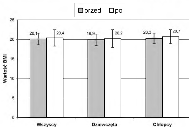
Wykres 2. Porównanie wartości BMI na początku i na końcu udziału w zajęciach

(m.in. hipoglikemii, dużych wahań stężeń glukozy we krwi, kwasie ketonowych etc.) oraz zredukować liczbę ponownych hospitalizacji. Pacjent podczas zajęć GWP miał szansę zidentyfikować swoje trudności, sposoby radzenia sobie z nimi oraz nauczyć się nowych prozdrowotnych sposobów funkcjonowania. Program terapii grupowej pomagał osiągać dorastającym diabetykom stabilizację i dojrzałość emocjonalną. Młodzież z cukrzycą nabywała większej samoświadomości i zwiększała się jej motywacja do wprowadzania zasad zdrowego stylu życia — m.in. dokonywania pomiarów stężenia glukozy we krwi, insulinoterapii, odpowiedniej diety. W grupie dziewcząt nastąpiły oczekiwane zmiany w czasie obserwacji. Brak wyraźnej poprawy w analizowanych parametrach w grupie chłopców w wieku dojrzewania może sugerować, że być może wymagają oni wydłużenia czasu udziału w zajęciach GWP lub innych metod psychologicznej pomocy. W przyszłości konieczna jest dokładna analiza i interpretacja oddziaływań oraz ocena wyników