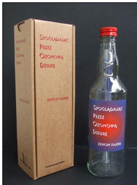
Ilustracja 1. Z. Fajfer, Spoglądając przez ozonową dziurę (2004)

Cielesność i związana z nią pełnia utworu liberackiego jest szczególnie wyraźnie widoczna w stworzonym i opublikowanym przez Fajferę w 2004 r. utworze w formie butelki (mającym własny numer ISBN!) Spoglądając przez ozonową dziurę [Fajfer 2004]. Dzieło posiada cielesną formę butelki, która nie jest jednak pustym semantycznie pojemnikiem na tekst, lecz kluczowym elementem, który należy interpretować w ścisłym związku z pozostałymi częściami utworu (w tym także z zawartym wewnątrz wierszem, który również charakteryzuje się specyficznym ułożeniem architektonicznym).