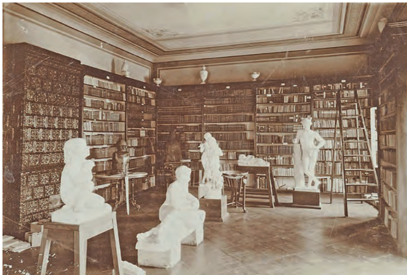
Il. 7. Widok wnętrza gmachu Biblioteki Fundacji Wiktora hr. Baworowskiego 1905 r. Fotografia 16,2 x 22,8 cm; źródło: Okna sztuki. Aukcja 22 (172) , oprac. Szczęsny P., Warszawa 2011, s. 207, (poz. 550).

s. 90–91, 109). Baworowianum latami kolekcjonując sztukę, nie tylko ozdobiło swą galerię dziełami nobliwego i wziętego także wówczas Grottegera, ale i zadbało o zabezpieczenie nabytych dzieł sztuki. Także i względem obrazów pracownicy biblioteki wykazali wysoką świadomość stałego dbania o wszystkie zbiory przechowywane w lwowskiej księżnicy.