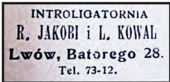
Il. 5. Nalepka proveniencyjna Introligatorni R. Jakobiego i L. Kowala. Fotografia ze zbiorów autora;