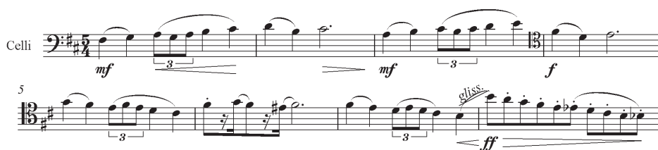
Przykład 6. P. Czajkowski, VI Symfonia h-moll Patetyczna , II cz. Allegro con grazia , temat wiolonczel, t. 1–8

II część przyjmuje typową trzyczęściową budowę pieśni ABA + coda. Brakuje w niej misternej harmonii, która nie jest konieczna przy tak wyrazistej sekundowej linii melodycznej tematu, w której dwutaktowe frazy są stale różnicowane poprzez dobór instrumentacji (przykład 6).