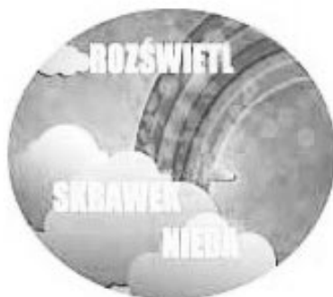
Ilustracja 2. Logo projektu „Rozświetl skrawek nieba”