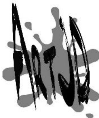
Ilustracja 1. Logo projektu „AJDart to dobry start”

Jak już wcześniej wspomniano, zmiany zachodzące w strukturze społecznej można podzielić na cztery obszary odnoszące się do różnych sieci powiązań. I tak pierwszy z nich to sfera oddziaływań interakcyjnych związanych z nawiązywaniem nowych kontaktów, wchodzeniem w nowe relacje czy łączeniem się w nowe grupy. Pojawiający się w deskrypcji przymiotnik „nowy”, poprzedzający dookreślenia obszarów interakcyjnych (kontakty, relacje, grupy), akcentuje zmianę związaną z pojawieniem się nieistniejącej do tej pory kategorii. Przykładem projektów animacyjnych takiego typu może być działanie, które odbywało się pod hasłem „AJDart to dobry start”.