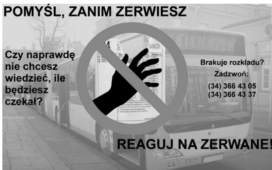
Ilustracja 3. Ulotka, akcja „Pomyśl, zanim zerwiesz – reaguj na zerwane!”

Trzecim obszarem zmiany strukturalnej, który dochodzi do głosu wówczas, gdy mówimy o kwestiach aksjonormatywnych, jest obszar reguł naszego funkcjonowania. Mówimy tutaj o sytuacji związanej z kierowaniem się nowymi normami, odgrywaniem nowych ról społecznych czy też zmianą w obszarze hierarchii wyznawanych wartości. Przykładem działań animacyjnych, których celem jest właśnie ten rodzaj zmiany, może być akcja prowadzona pod hasłem „Pomyśl, zanim zerwiesz – reaguj na zerwane!”.