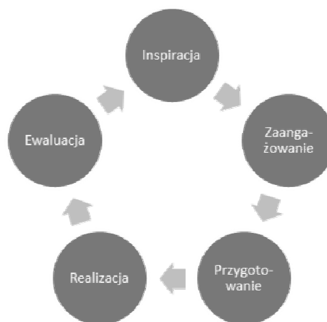
Rys. 1. Cykl „Inspiracja – Zaangażowanie – Przygotowanie – Realizacja – Ewaluacja”. Opracowanie własne na podstawie [3]

Oczywiście, podstawą każdej decyzji (także tej dotyczącej wyboru zawodu i przyszłej kariery) jest inspiracja (rysunek 1).