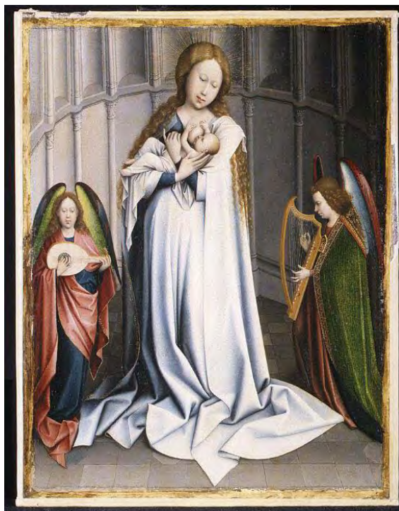
Fig. 6 Copia según Robert Campin, La Virgen en el ábside, óleo sobre lienzo, trasladado de una tabla, 45 x 35 cm, Nueva York, © Metropolitan Museum of Art, n° inv. 05.39.2