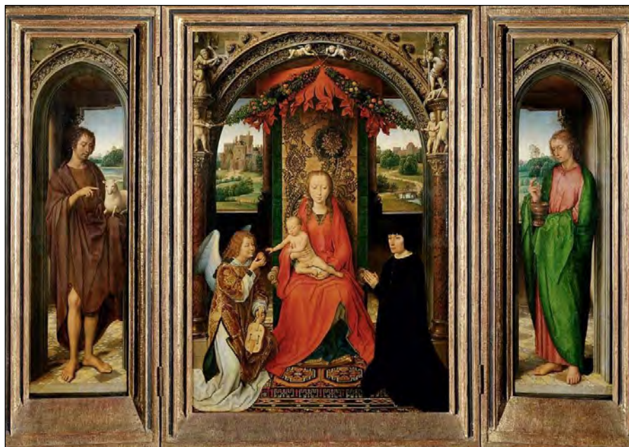
Fig. 7 Hans Memling, El Altar de los Santos Juanes, 1485-1490, óleo sobre tabla, 69,3 x 47 cm, Viena, © Kunsthistorisches Museum, n° inv. Gemäldegalerie 930.