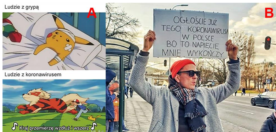
Figura 1. Ejemplos de memes con esquemas narrativos de comedia (a) y tragedia (b)

75 memes representan el esquema de «tragedia», lo cual lo convierte en el tercero más común. El ejemplo de un meme en esta categoría proviene de Facebook (Koronawirus memy, 2020) en el que un joven está de pie junto a una parada de autobús sosteniendo un cartel con el texto: «Anuncia [la existencia] de este coronavirus en Polonia, porque esta tensión será mi fin» (Figura 1 - b). Es un comentario sobre las autoridades polacas y los medios de comunicación públicos que no tomaron en serio los rumores sobre un brote de Covid-19 en Polonia, cuando tales especulaciones fueron reportadas por otros medios, y se registraron infecciones del virus en los estados vecinos.