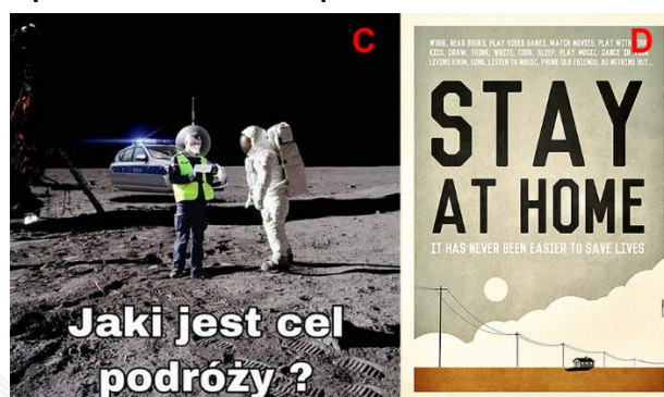
Figura 2. Ejemplos de memes con esquemas narrativos de sátira (c) y épica (d)

El esquema satírico incluye 96 memes y es el segundo tipo de narrativa más frecuente. Un ejemplo de esta narrativa es un meme del Polska Times (2020b) (Figura 2-c) donde una patrulla de policía polaca detiene a un astronauta. El policía pregunta: «¿Cuál es el propósito de su viaje?»