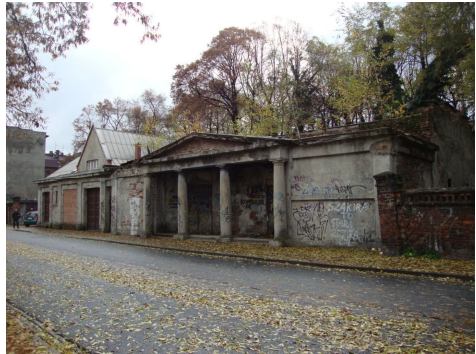
Ryc. 11. Dom pogrzebowy przy cmentarzu żydowskim w Katowicach