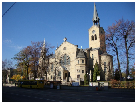
Ryc. 3. Kościół ewangelicko-augusburski przy ul. Warszawskiej