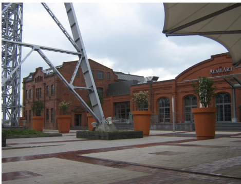
Ryc. 6. Elementy dawnej zabudowy przemysłowej kopalni węgla kamiennego Gottwald na terenie Silesia City Center

Najslabiej zachowaną i najbardziej narażoną na całkowitą likwidację grupą są elementy zabudowy hut, kopalń czy fabryk. W związku z restrukturyzacją przemysłu i rewitalizacją zdegradowanych terenów poprzemysłowych systematycznie znikają one z przestrzeni miasta. Do zachowanych można zaliczyć kilka zabytkowych budynków, zlokalizowanych na terenie dawnej kopalni Gottwald, gdzie mieści się Silesia City Center (ryc. 6), czy na terenie dawnej kopalni Katowice, gdzie mieści się Nowe Muzeum Śląskie, oraz budynki czynnej jeszcze kopalni Wieczorek (ryc. 7) (Chmielewska 2010). Zachowana, aczkolwiek w bardzo złym stanie, jest także zabudowa huty Uthemanna w Szopienicach. Dla kontrastu, w dobrym stanie znajduje się odrestaurowana zabudowa szopienickiego browaru Mokrskich.