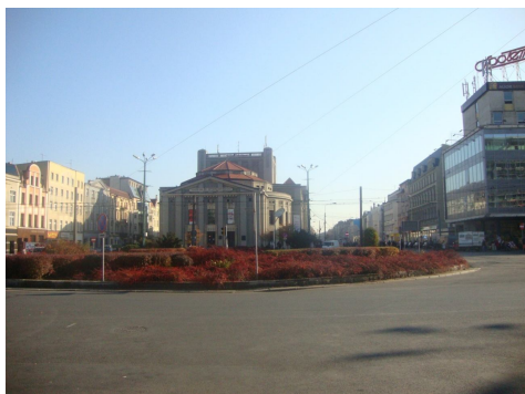
Ryc. 2. Teatr Śląski im. S. Wyspiańskiego