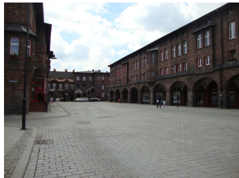
Ryc. 9. Fragment zabudowy osiedla patronackiego Nikiszowiec