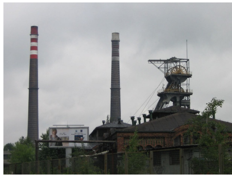
Ryc. 7. Szyb Pułaski