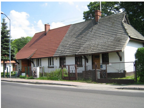
Ryc. 8. Fragment pierwotnej zabudowy mieszkaniowej osiedla patronackiego Giszowiec