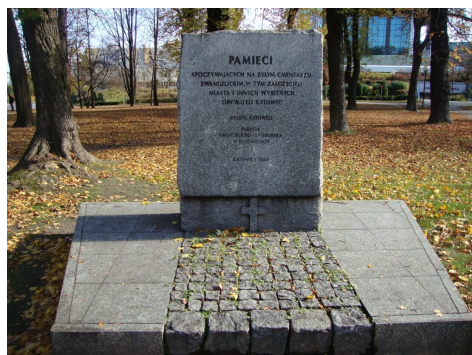
Ryc. 5. Tablica pamiątkowa w miejscu dawnego cmentarza ewangelickiego przy ul. Damrota

Dziedzictwo przemysłowe pozostałe po działalności „wielkich przemysłowców” jest dla odmiany możliwe do znalezienia w różnych zakątkach współczesnych Katowic, wszędzie tam, gdzie prowadzili oni swoją działalność. Przede wszystkim należy wyróżnić tu trzy grupy obiektów: zabudowę zakładów przemysłowych, osiedla i kolonie patronackie oraz rezydencje właścicieli zakładów przemysłowych.