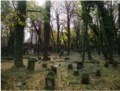
Ryc. 10. Kirkut przy ul. Kozielskiej

litwy przy synagodze jest dziś przychodnia zdrowia (ryc. 12). Do dziś przetrwał również budynek łaźni rytualnej, sąsiadujący z Wielką Synagogą, w którym obecnie mieści się bank (Dudała, Dziwoki 2004, Suchacka, Szczepański, Ślęzak-Tazbir 2007).