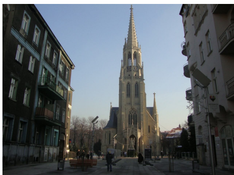
Ryc. 4. Kościół katolicki przy ul. Mariackiej