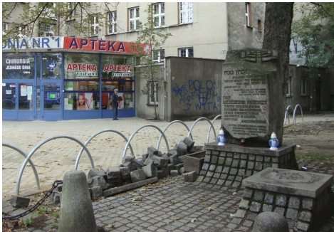
Ryc. 12. Tablica pamiątkowa w miejscu Synagogi Wielkiej w Katowicach oraz zachowany budynek domu modlitewnego przy synagodze – obecnie przychodnia zdrowia