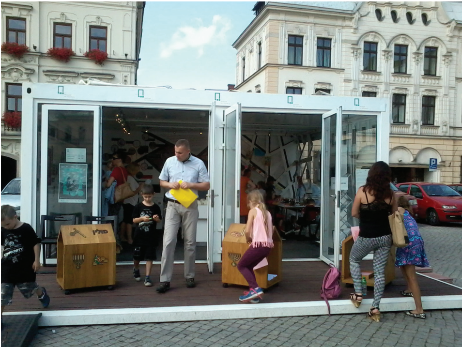
Fot. 1. Kontener muzealny na cieszyńskim rynku wyeksponowany latem 2015 roku w Polsce przez Muzeum Historii Żydów Polskich POLIN (fot. M. Szalbot, lipiec 2015)

W ciągu ostatnich kilku dziesięcioleci muzealnicy przyzwyczaili odbiorców do obcowania z różnymi formami działań muzealnych, które są realizowane poza salami ekspozycyjnymi. Również w Polsce nie wywołuje to już większego zdziwienia nawet wśród mieszkańców kilkudziesięciotysięcznych miast. Nie mam tu wyłącznie na myśli różnych wariantów mobilnego muzeum, którego interesującym przykładem w 2013 roku była wystawa dotycząca obrzędowości wielkanocnej, zorganizowana przez Muzeum Śląskie w Katowicach w wagonie jednej z linii tramwajowych, czy też przybyły w lipcu 2015 roku do Cieszyna kontener muzealny, w trakcie zaplanowanego na lata 2014–2016 przez POLIN Muzeum Historii Żydów Polskich tournée po czterdziestu siedmiu polskich miejscowościach, których tradycje kulturowe przed drugą wojną światową współtworzyła zamieszkująca w nich licznie społeczność żydowska.