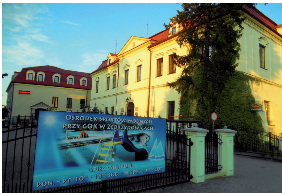
Fot. 6. Dobudowana sala widowiskowa do zamku w Zebrzydowicach oraz banery i świecące reklamy przy zamku