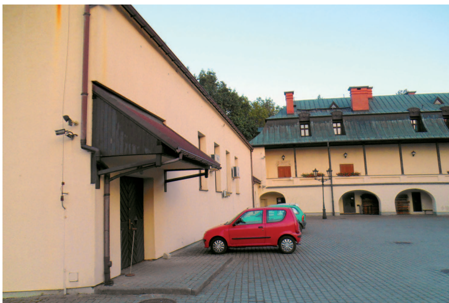
Fot. 5. Dobudowana sala widowiskowa do zamku w Kończycach Małych

Rozbudowa/przebudowa pałacu i jej zakres: w 1960 r. dobudowano trzecie skrzydło zamku – salę widowiskową, zaburzając oryginalną substancję zabytkową (fot. 5).