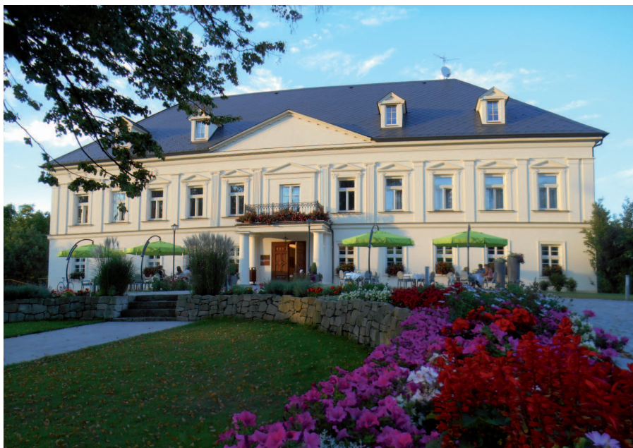
Fot. 4. Myśliwski pałac w stylu empire w Prstnej