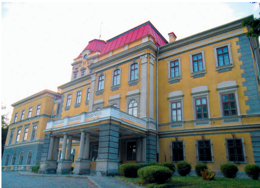
Fot. 1. Klasycystyczny pałac w Kończycach Wielkich