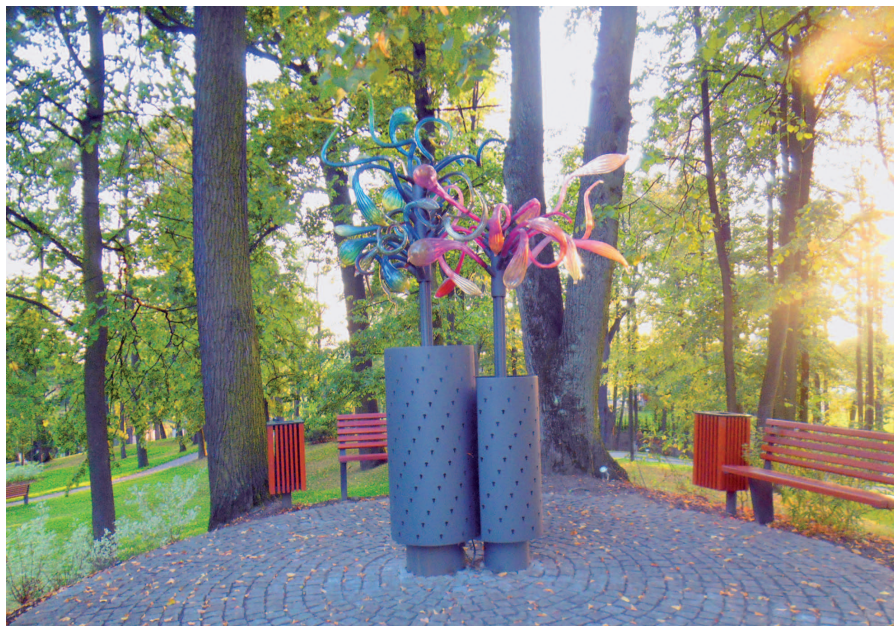
Fot. 8. Nowoczesne rzeźby w zabytkowym parku przypałacowym w Prstnej

Zabytkowe cechy architektoniczne pałacu: w fasadzie tympanon bez płaskorzeźby, pilastry jońskie przy balkonie na I piętrze, dekoracyjne obramienia okien, lizeny, kolumny podtrzymujące balkon, we wnętrzu zabytkowa boazeria angielska i drewniany parkiet.