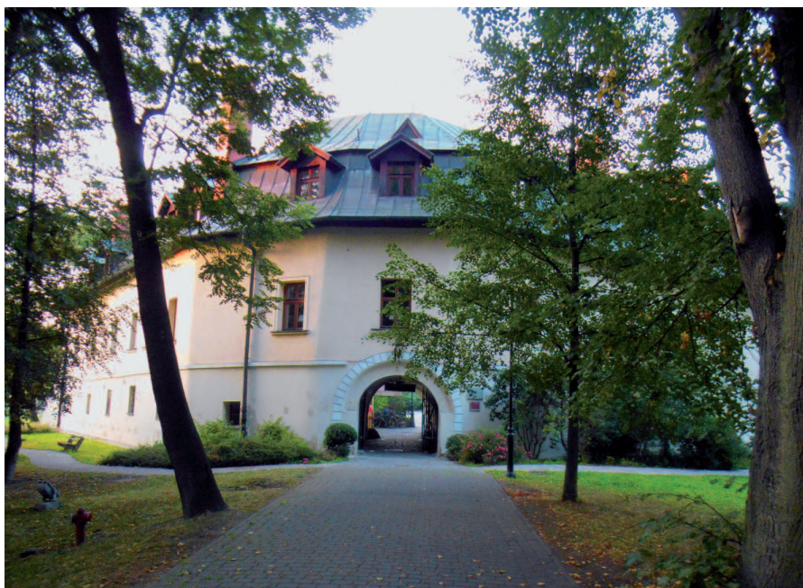
Fot. 2. Renesansowy zamek w Kończycach Małych