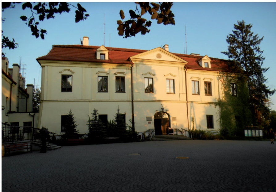
Fot. 3. Barokowy zamek w Zebrzydowicach