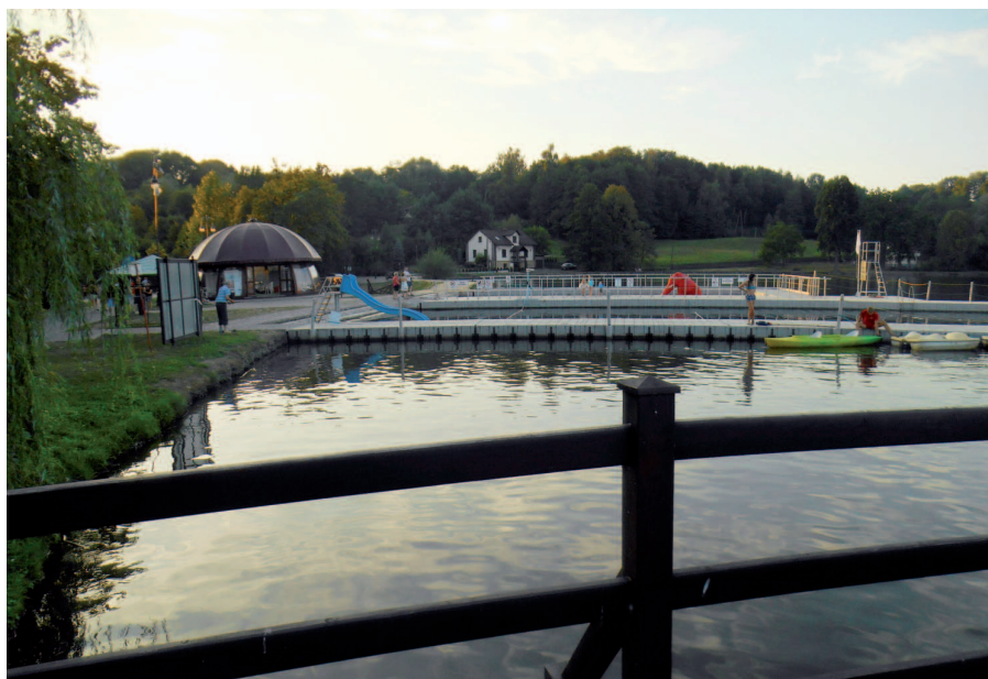
Fot. 7. Ośrodek sportów wodnych na stawie przyzamkowym Młyńszczok w Zebrzydowicach