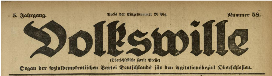
Bild 2. Zeitungskopf der "Volkswille"

er als Vertreter der damaligen Regierungspartei in Deutschland im Deutschen Ausschuss für Oberschlesien 30 .