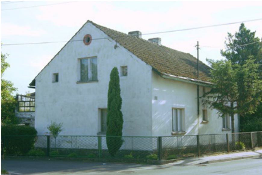
Bild 4. Okonskys Häuschen in Ratiborhammer 90

Stadt Ratiborhammer 91 zu ziehen, die damals innerhalb der preußischen Grenzen lag. Hier erwarb er ein Haus mit einem großen Garten, der von nun an zur Grundlage seiner Existenz werden sollte 92 . Er beschloss, wie in seiner Jugend, wieder Gärtner zu werden. Dem Okonsky war es bewusst, wie gefährlich Politik sein kann, um eine triviale Existenz sichern zu können 93 .