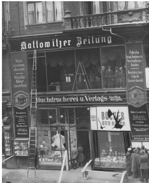
Bild 3. Sitz der Redaktion der „Kattowitzer Zeitung“