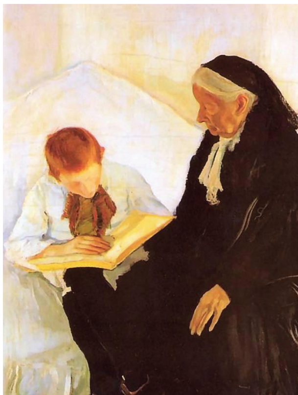
Ilustracja 1. Konrad Krzyżanowski, Babcia z wnuczkiem , 1915, Muzeum Narodowe, Warszawa.

Lektorem, wokół którego zwykle koncentrują się sceny czytania, jest osoba emocjonalnie bliska słuchaczom, która niejako użycza książce swojej osobowości, a także autorytetu. Niemal zawsze w tej roli występują kobiety. To przede wszystkim matka lub babcia, czasem starsza siostra, wprowadzają dziecko w świat literatury. W przedstawieniu Konrada Krzyżanowskiego (ilustr. 1.)