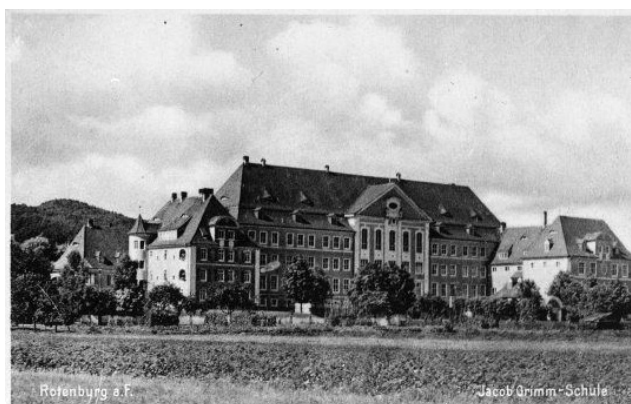
Il. 2. Jacob Grimm Schule, pocztówka z ok. 1930 r.

Fotografia została wykonana na tle budynku szkoły znajdującej się w Rotenburgu Jacob Grimm Schule 23 . Pod koniec sierpnia 1939 r., tuż przed wybuchem II wojny światowej w budynku szkolnym powstał szpital wojskowy. Od 1 grudnia 1939 r. budynek został przekształcony na obóz jeniecki dla ponad 400 polskich oficerów i kilkudziesięciu polskich kapelanów wojskowych.