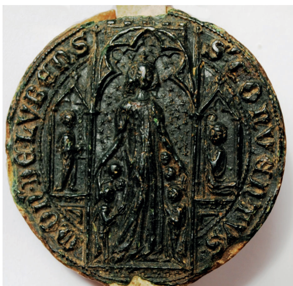
Il. 3. Pieczęć konwentu II w Lubiążu; AP Wrocław, Rep. 91, nr 292 (odcisk pieczęci z 1343 r.)