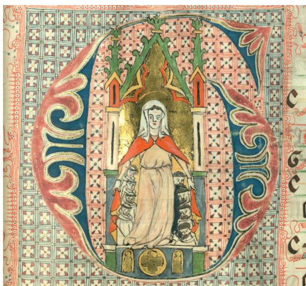
Il. 4. Graduał lubiąski, inicjał G(audeamus) ; BUWr., Oddział Rękopisów, sygn. I F 413, k. 145r (pierwsza połowa XIV w.)