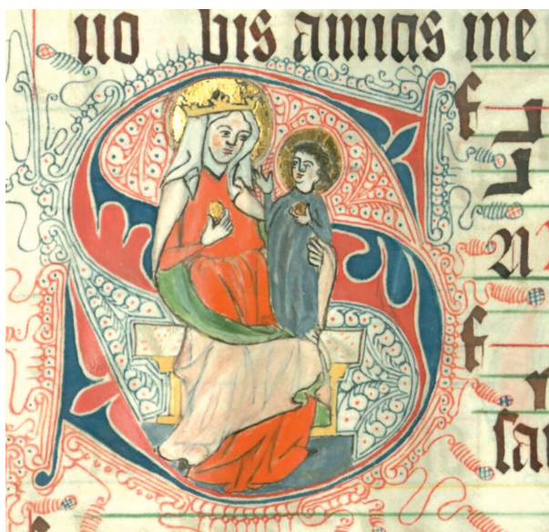
Il. 2. Graduał lubiąski, inicjał S(alve) ; BUWr., Oddział Rękopisów, sygn. I F 413, k. 144r (pierwsza połowa XIV w.)