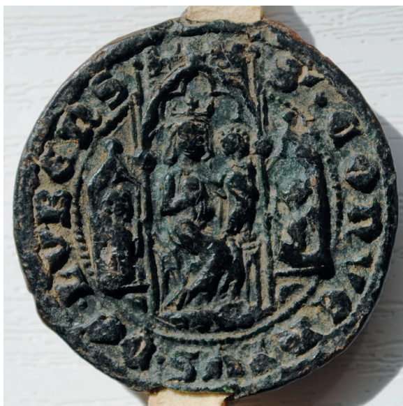
Il. 1. Pieczęć konwentu I w Lubiążu; AP Wrocław, Rep. 125, nr 186 b (odcisk pieczęci z 1341 r.)