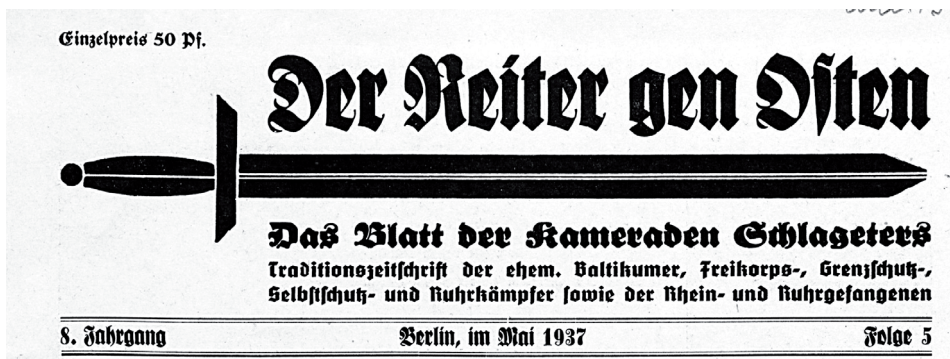
Fot. 3. Fragment strony tytułowej niemieckiego miesięcznika propagandowego „Der Reiter gen Osten: das Blatt der Kameraden Schlageters”