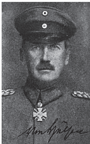
Fot. 2. Gen. Bernhard von Hülsen