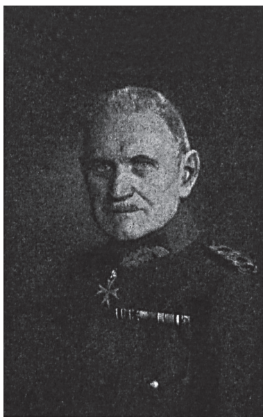
Fot. 1. Gen. Karl Hoefler