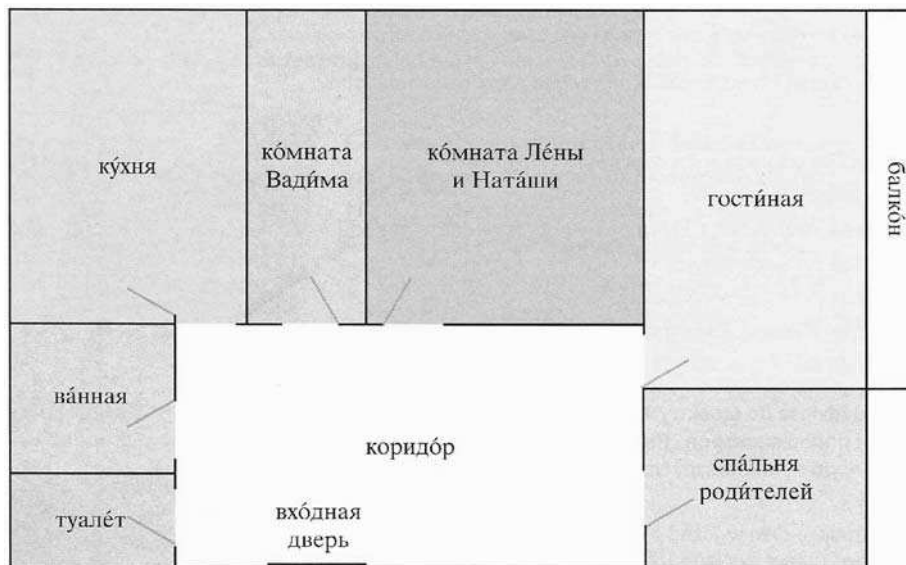
Rys. 1. Część wizualna omawianego ćwiczenia percepcji leksyki

Wybór takiej leksyki potwierdzają słowniki tematyczne [Rieger, Rieger 2003; Морковкин 2003]. Oznacza to, że omawiane leksemy są bezpośrednio związane z precyzowanym zakresem tematycznym. Jeśli byłyby to słowa z rozmytym znaczeniem, nie zostałyby wpisane w ramy danego tematu. Ale już zaproponowane w omawianym schemacie połączenie wyrazowe входная дверь nie figuruje w słownikach; rzeczownik дверь jest dookreślany jedynie poprzez wyrażenia: в коридор , в комнату , на лестницу , балкон , дверь-купе , a także глазок , почтовый ящик [Rieger, Rieger 2003] 7 . Jednak niezależnie od faktu, że słowniki tematyczne opierają się na statystycznych danych odnośnie do użycia języka, to jednak nie są one obliczone na stopień zaawansowania językowego docelowego audytorium. Dlatego też uzasadnione wydaje się odwołanie się do słownika częstotliwości użycia słów [Морковкин 2003: 599–744]. Wskazane opracowanie klasyfikuje wyrażenia na 10 poziomach, obejmujących odpowiednio od 500 do 5000 najczęściej używanych słów w języku rosyjskim. Szacuje się, że przeciętny użytkownik języka