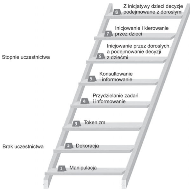
Rys. 1. Drabina poziomów uczestnictwa społecznego dzieci według Rogera Harta