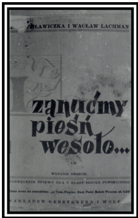
Ilustracja 5. Okładka III wydania podręcznika Zanućmy pieśń wesóło dla V klasy szkoły powszechnej