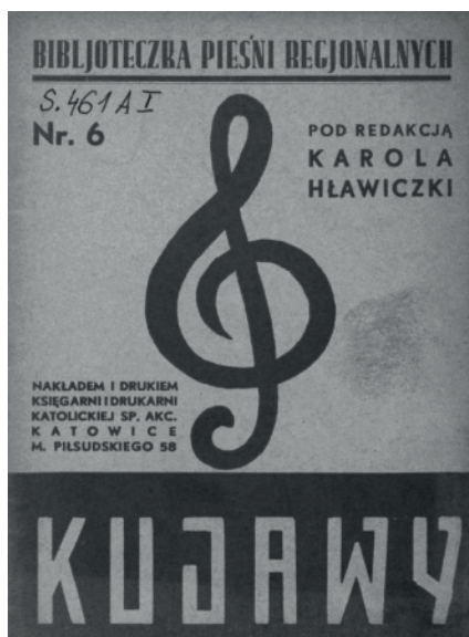
Ilustracja 4. Numer 6 „Biblioteczki Pieśni Regionalnych”

Doceniając ogromną wartość pieśni ludowej w nauczaniu muzyki, Hławiczka wraz z grupą współpracowników opracowywał dla szkół cykl wydawnictw nutowych w ramach tzw. „Biblioteczki Pieśni Regionalnych”, zwanej też często „Małym Kolbergiem”. W latach 1935–1938 ukazały się kolejno: nr 1 Górny Śląsk, nr 2 Śląsk Cieszyński, nr 3 Kaszuby, nr 4 Krakowskie, nr 5 Lubelskie, nr 6 Kujawy (ilustracja 4.), nr 7 Podhale, nr 8 Mazowsze, nr 9 Wielkopolska, nr 10 Wileńskie, nr 11 Świętokrzyskie, nr 12 Podole, nr 13 Podlasie, nr 14 Polesie, nr 15 Wołyń, nr 16 Kaliskie 12 .