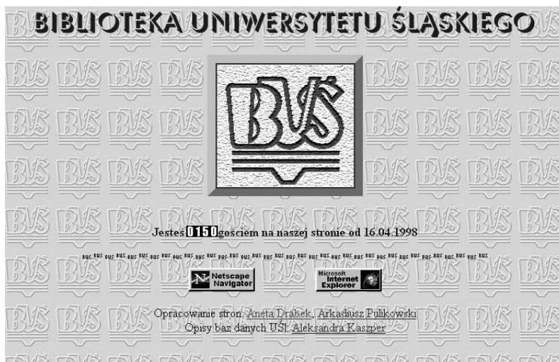
Rys. 1. Nowa strona domowa Biblioteki Uniwersytetu Śląskiego zaprojektowana na przełomie 1997 i 1998 roku (strona główna)

Na początku 1998 projekt strony był gotowy. Do jej napisania użyliśmy bezpłatnego programu Homesite 1.2. Skomponowaliśmy specjalne tło strony startowej – wypukłe logo Biblioteki wypełniało błękitne tło. Kliknięcie w duże logo na środku przenosiło na podstronę, która stanowiła jednocześnie przewodnik po serwisie. Menu umieszczone po lewej stronie ułatwiała nawigację w stronie, a informacje pojawiały się w panelu zajmującym większą część ekranu.