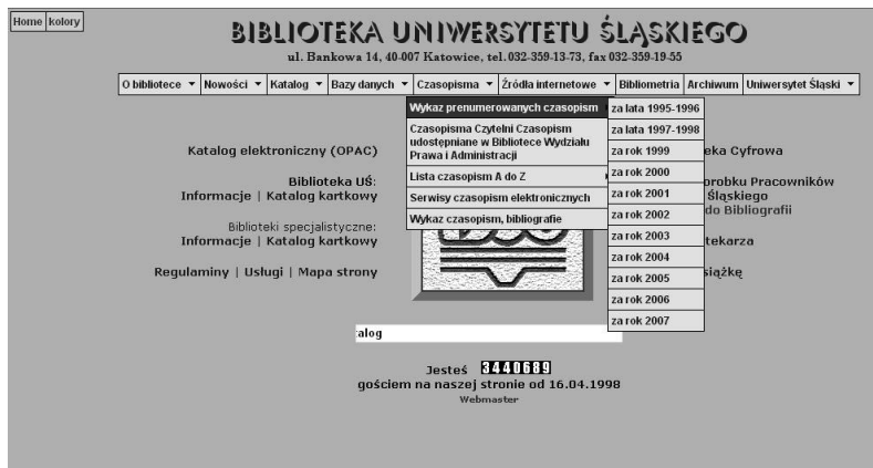
Rys. 5. Strona Biblioteki 2004–2007