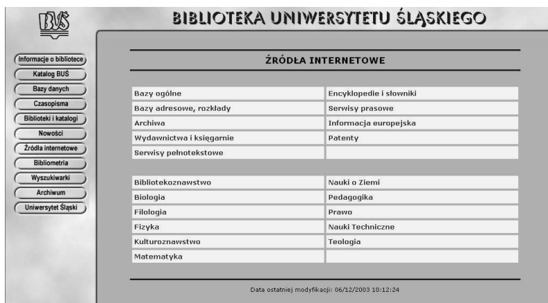
Rys. 4. Baza źródeł elektronicznych

W 2003–2004 znacznie poszerzono zestaw odnośników do ciekawych źródeł elektronicznych i przydatnych stron internetowych. Każdy link został starannie wybrany, a większość z nich opatrzona objaśnieniem. Kilkaset posegregowanych tematycznie źródeł złożyło się na ciekawą bazę danych, która stanowi nieocenioną pomoc dla bibliotekarzy i czytelników.