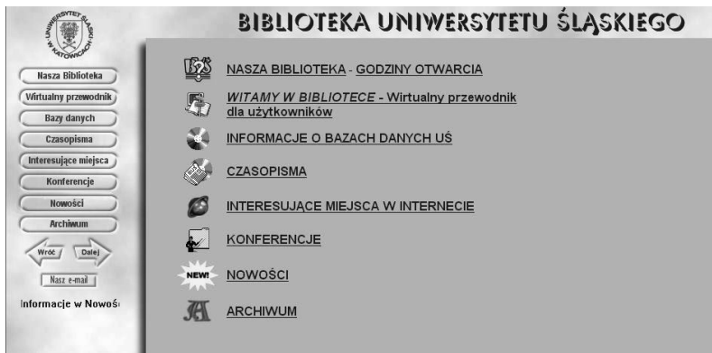
Rys. 2. Menu strony Biblioteki Uniwersytetu Śląskiego zaprojektowanej na przełomie 1997 i 1998

Na nowej stronie znalazły się informacje teleadresowe i godziny otwarcia poszczególnych agend Biblioteki Głównej Uniwersytetu Śląskiego, jak również podstawowe informacje dotyczące sieci bibliotek specjalistycznych UŚ. Wyeksponowano informację o bazach danych na CD-ROM-ach oraz on-line, które dostępne były w lokalnej sieci.