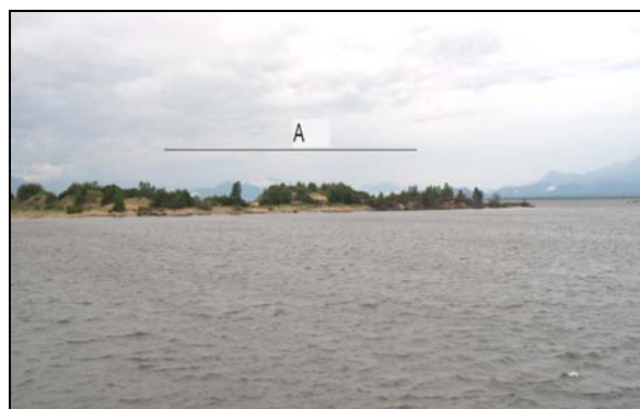
Fot. 2. Ogólny widok wschodniego krańca w. Jarki: A – obszar objęty szkicem geomorfologicznym – por. rys. 2 Phot. 1. Eastern part of Yarki Island – general view: A – area of geomorphological sketch-map – see fig. 2

Ukształtowanie terenu wschodniego krańca Jarków Limbowych jest dość urozmaicone, bowiem występuje tu wiele form wypukłych i wklęsłych (fot. 2).