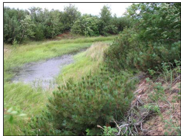
Fot. 4. Zawodniona niecka deflacyjna na obszarze badań Photo 4. Water-logged deflation depression in the area investigated

ku północo-zachodowi i jest bardzo typowy dla tego terenu.