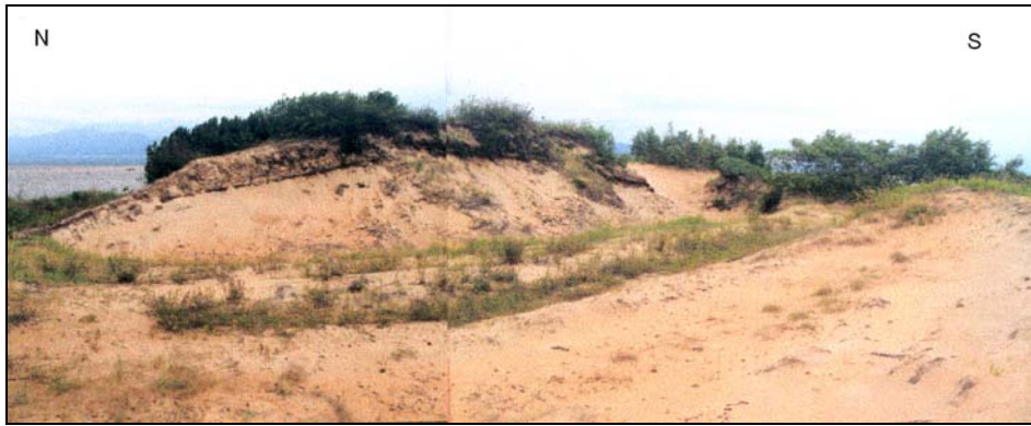
Fot. 3. Główne eoliczne formy rzeźby wschodniego krańca Jarków Phot. 3. Main aeolian landforms of eastern part of Yarki Island