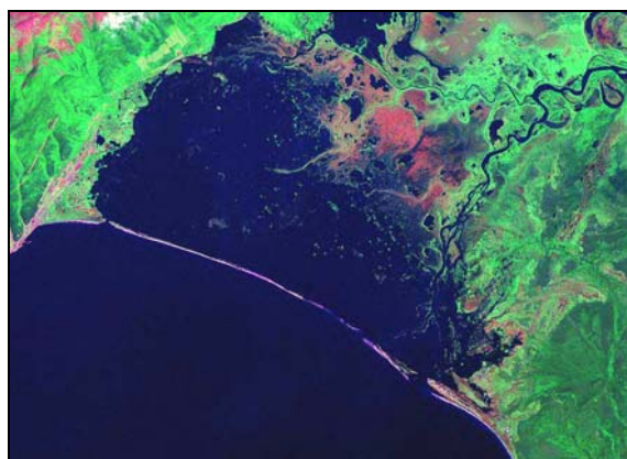
Fot. 1. Wyspa Jarki (wg: program Mars Google) Phot. 1. Yarki Island (after: Mars Google programme)